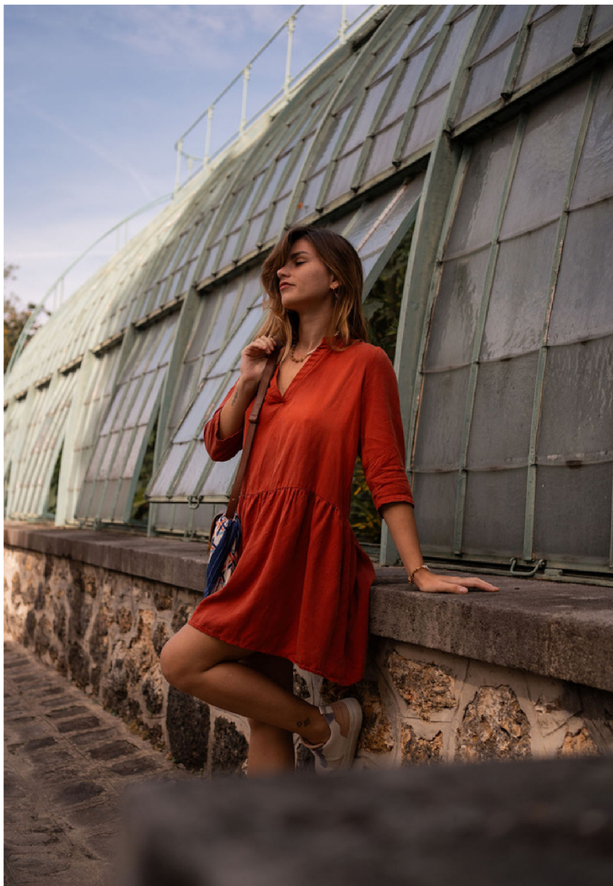
Robe Roma Terracotta