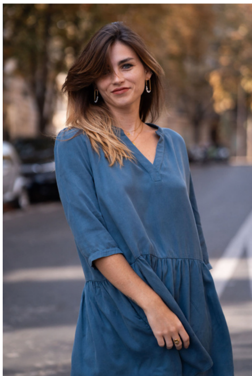
ROBE ROMA BLEU CALANQUE